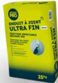
ENDUIT A JOINT ULTRA FIN SAC 25KG Code produit : 1853889

60 SACS ACHETÉS = 1 CHÈQUE CADEAU DE 10 € TTC OFFERT !