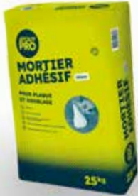
MORTIER ADHESIF SAC 25KG Code produit : 1853892

50 SACS ACHETÉS = 1 CHÈQUE CADEAU DE 10 € TTC OFFERT !