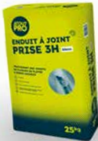
ENDUIT A JOINT PRISE RAPIDE 3H SAC 25KG Code produit : 1853905

56 SACS ACHETÉS = 1 CHÈQUE CADEAU DE 10 € TTC OFFERT !