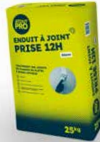
ENDUIT A JOINT PRISE LENTE 12H SAC 25KG Code produit : 1853906

50 SACS ACHETÉS = 1 CHÈQUE CADEAU DE 10 € TTC OFFERT !